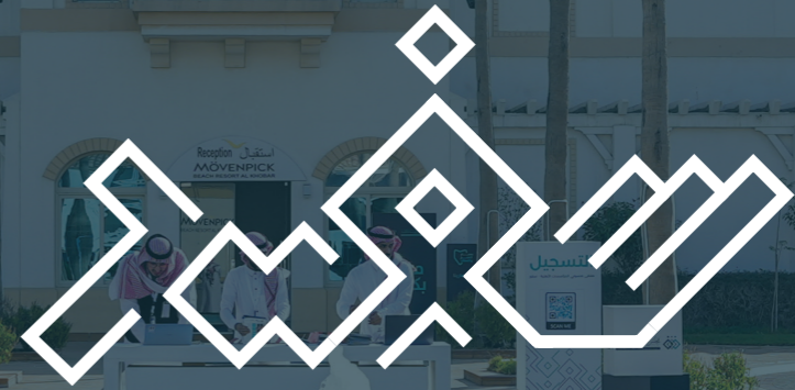
ملتقى منسوبي المؤسسات الأهلية