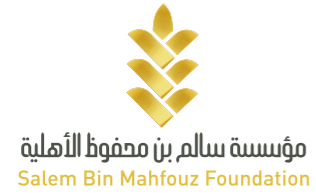
مؤسسة سالم بن محفوظ الأهلية Salem Bin Mahfouz Foundation