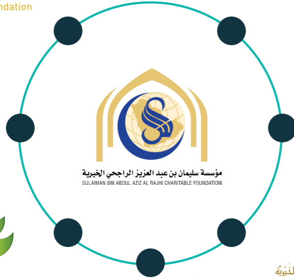
مؤسسة سليمان بن عبد العزيز الراجحي الخيرية SULAIMAN BIN ABDUL AZIZ AL RAJHI CHARITABLE FOUNDATION